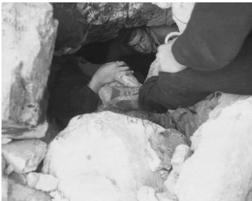
Vzpomínka na tábor na Slapech 1955