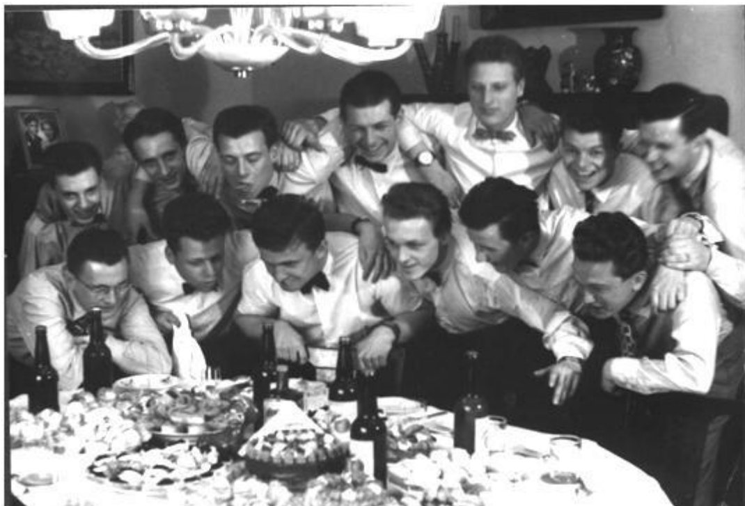
Vzpomínka na Velikonoční plavbu po Sázavě