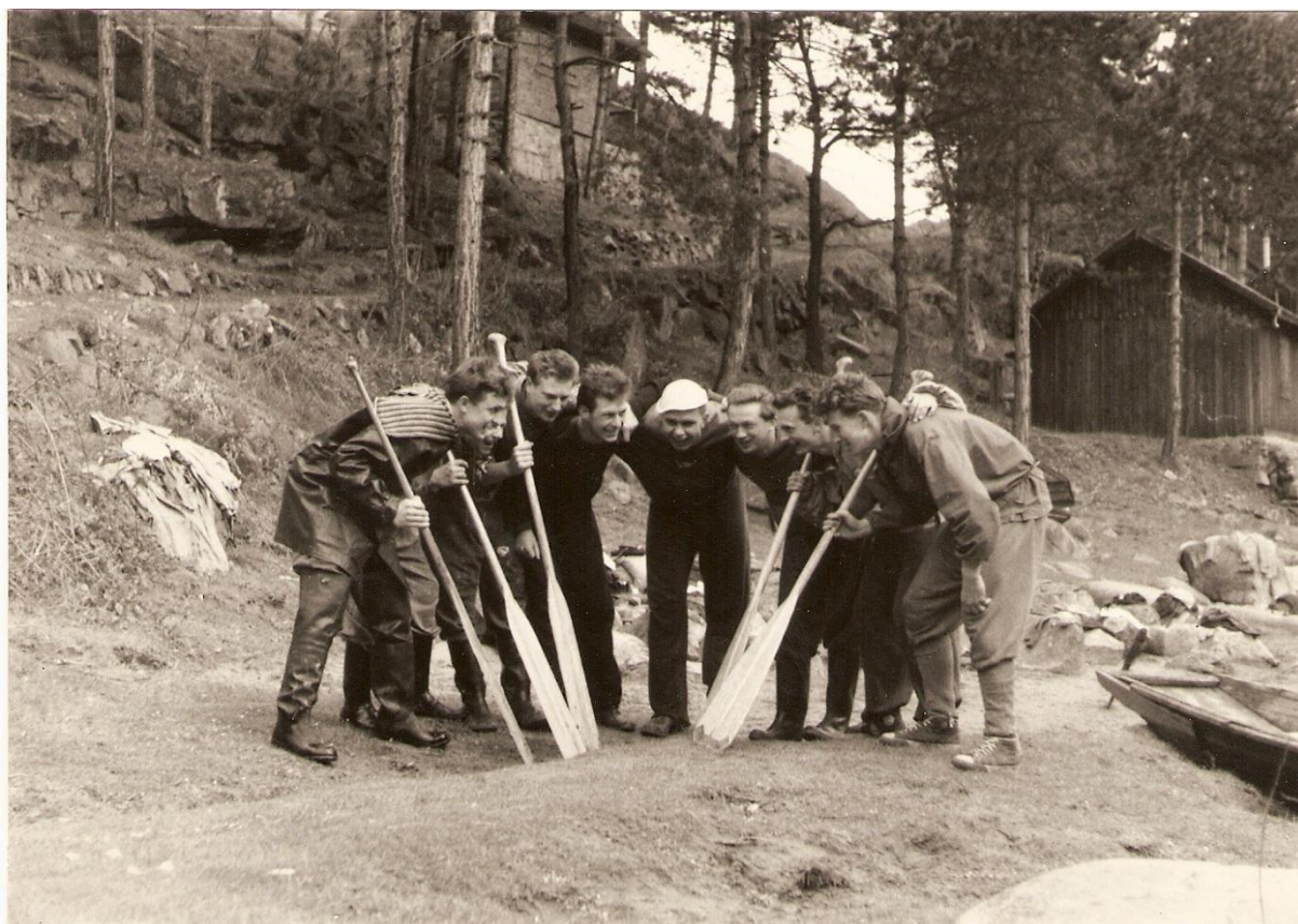
Na Sázavě pokřik po rozpadu pramice Gospa Poišana II.